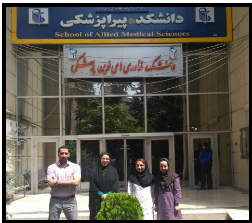
تهیه و تنظیم: اسفند ماه ۱۳۹۷

برای آن که ایران کوهری تابان شود خون دلها خورده ایم